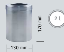
Table Boy Art. 320 204-41