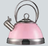
WESCO KESSEL WESCO KETTLE KA 21