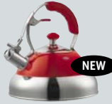
KESSEL/KETTLE CLASSIC LINE KA 23