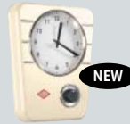
KÜCHENUHR KITCHEN CLOCK CLASSIC LINE KA 27